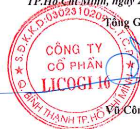
Vũ Công Hưng