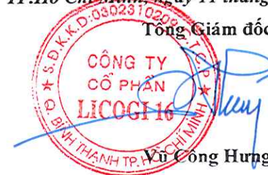
Vũ Công Hưng